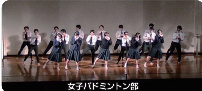
女子バドミントン部